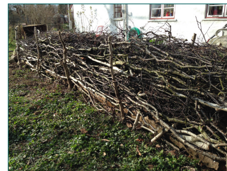
Man kan nemt lave kvasbunken til et grenhegn i haven, og bruge det til at lave rum eller afgrænsninger.

Dyrene er dog ligeglade med, om kvaset er lagt i sirlige bunker. Alt det træ og kvas, man beholder i haven binder CO 2 , så kvasbunker hjælper også en lille smule i klimaregnskabet.