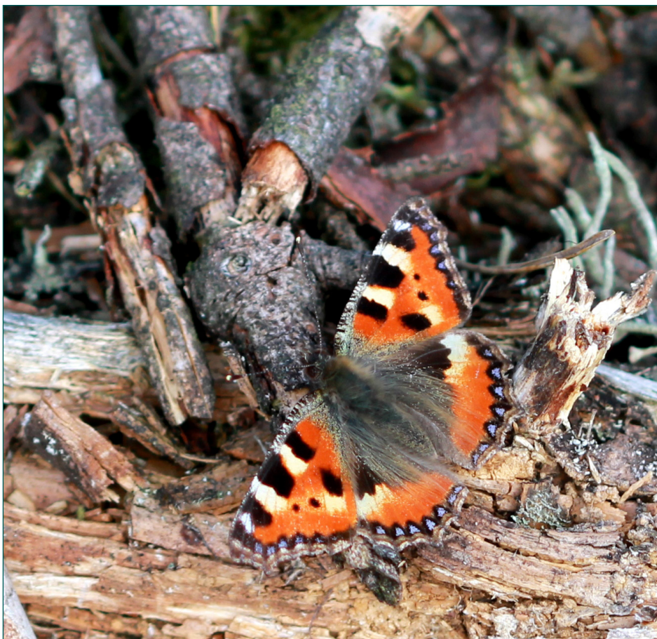
Nældens takvinge soler sig på en lun kvasbunke.